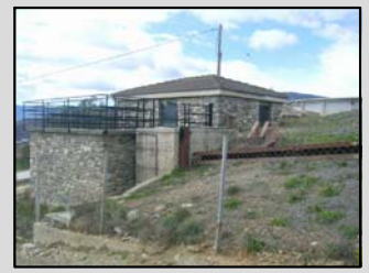
C. nº 3: Dipòsits Bellestar