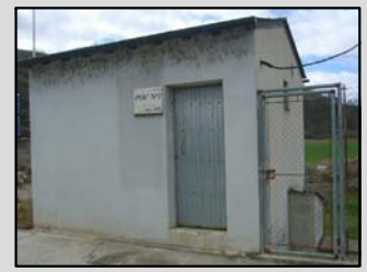
C. nº 2: Pou Nou