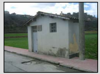
C. nº 1: Pou Vell