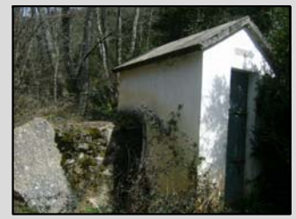
C. nº 4: Barranc del Mas