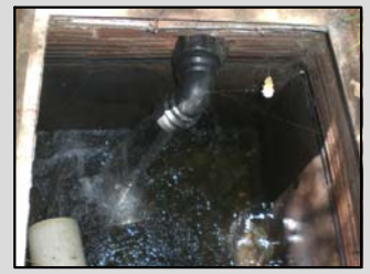
C. nº 6, 7, 8: Font de Cal Rogé